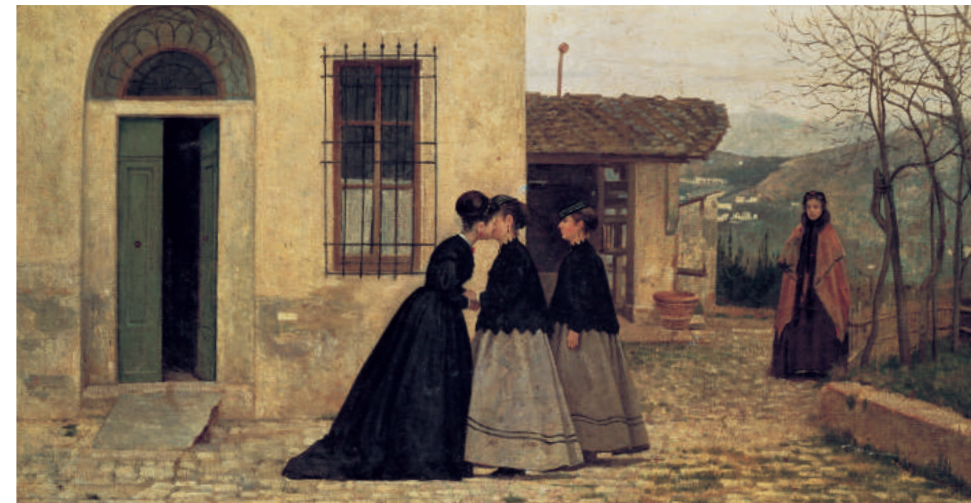
Silvestro Lega, La visita , Galleria d'Arte Moderna, Roma