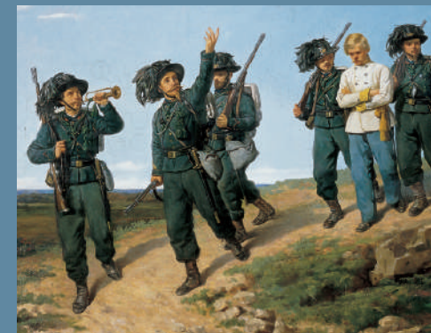
Silvestro Lega, I bersaglieri , Galleria d'Arte Moderna, Palazzo Pitti, Firenze

La mostra (costituita da novanta opere, delle quali