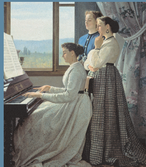
Silvestro Lega, Lo stornello , Galleria d'Arte Moderna, Palazzo Pitti, Firenze

sessanta di Lega) intende offrire una panoramica selezionata ed esaustiva della produzione di Silvestro Lega, sottolineando come all'impegno dei temi affrontati corrispondano sempre una intensità e una novità della ricerca pittorica, rimaste uniche ed ineguagliabili nel panorama non solo della esperienza dei Macchiaioli, ma dell'intero Ottocento italiano.