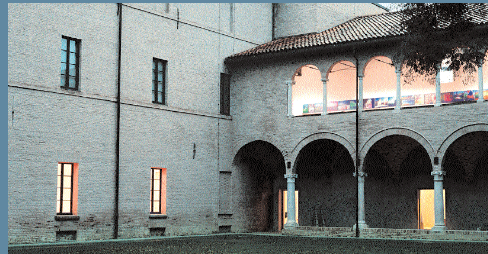
Musei San Domenico, interni e primo chiostro