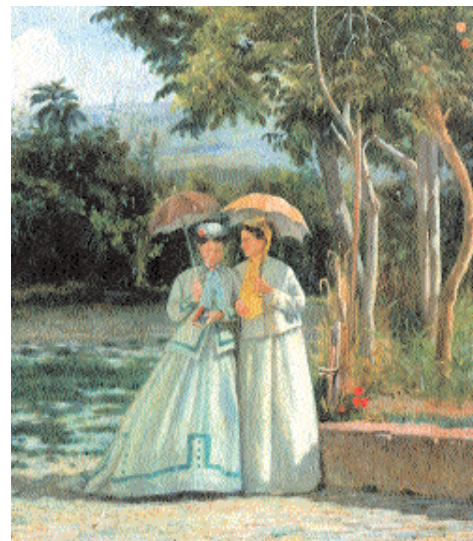
Silvestro Lega, La passeggiata in giardino , Galleria d'Arte Moderna, Palazzo Pitti, Firenze

Nella pittura macchiaiola convivono essenzialmente tre anime: quella monumentale, virile e schietta di Fattori, l'altra borghese, eccentrica e raffinata di Signorini e, infine, la discreta, intima e poetica di Lega. Quest'ultima meglio delle altre riflette gli aspetti distintivi e caratterizzanti della grande tradizione dell'arte italiana, ovvero il culto del disegno e il rispetto della forma. Il modo originale con cui un artista si rapporta alla società del proprio tempo attraverso un dialogo di timbro realista, in costante evoluzione. I personaggi di Lega si muovono in un'atmosfera tutt'altro che ostile e conflittuale con la vita, e specchio di questa grande serenità interiore sono opere quali L'elemosina , Il canto di uno stornello , Una visita , Un dopo pranzo , I fidanzati , per meglio dire l'intero ciclo scaturito dall'intimo rapporto di Lega con Virginia Batelli, nonché dalla cordiale frequentazione dell' entourage della villetta dove la donna, come la protagonista di un "romanzo della vita domestica", calata però in una dimensione tutta toscana resa vaporosa dalle nebbie del primo mattino della campagna intorno a Firenze, vive appagata di un affetto che non è solamente quello familiare.